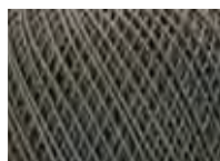
Teal green Col: 00611 NEW