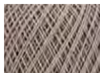
Ice linen Col: 00590 NEW