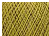
Golden Ochre Col: 00684 NEW