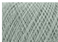
Ice green Col: 00676 NEW