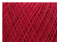
Magenta Col: 00606 NEW