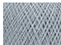
Ice blue Col: 00642 NEW