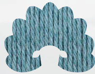
00400 blue topaz