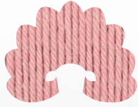
00893 rose quartz