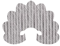
00398 moonstone grey