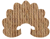
00888 smoky quartz