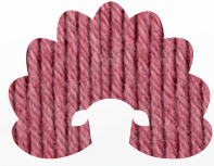
00078 pink ruby