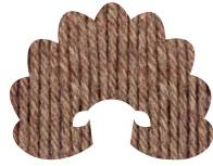
00357 tiger's eye