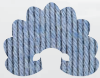
00920 blue opal