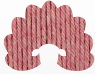
00895 pink topaz