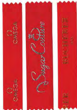
Goldfolie Silberfolie Kupferfolie