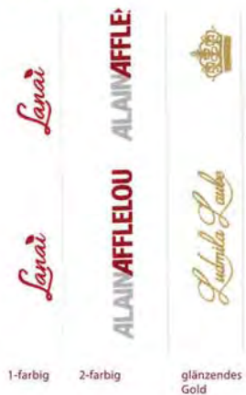
1-farbig 2-farbig glänzendes Gold