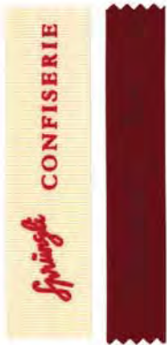
Lackfarbe transparenter Lack