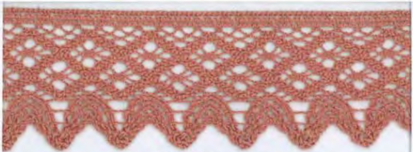
DENTELLE COTON Réf 4043 Bobine de 16,50 m "B"