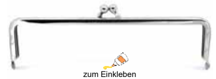
Art.-Nr.: BG1-16x4-V419-N zum Einkleben Größe: 16 x 4cm, Farbe: silber Abnahme: Beutel mit 5 Stück