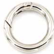
Art.-Nr.: KHR-25-N Karabinerring Ø innen: 25mm, 6mm dick Farbe: silber Abnahme: Beutel mit 10 Stück