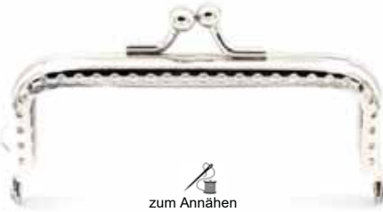
Art.-Nr.: BG-SW084-N zum Annähen, mit 1 Ringöse Größe: 8,5 x 4cm, Farbe: silber Abnahme: Beutel mit 5 Stück