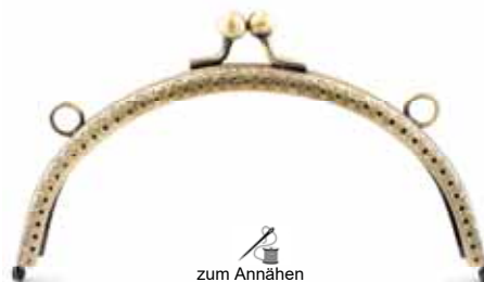
Art.-Nr.: BG-SW0168-AB zum Annähen, mit 2 Ringen Größe: 16,5 x 8cm, Farbe: altmessing Abnahme: Beutel mit 5 Stück