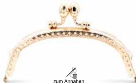
Art.-Nr.: BG-SW0125-HRG zum Annähen, mit 2 Ringösen Größe: 12,5 x 5,5cm, Farbe: hell rotgold Abnahme: Beutel mit 5 Stück