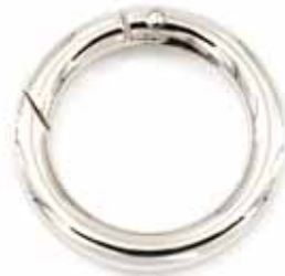
Art.-Nr.: KHR-30-N Karabinerring Ø innen: 29mm, 6mm dick Farbe: silber Abnahme: Beutel mit 10 Stück