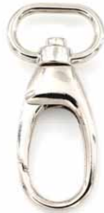
Art.-Nr.: KH-381-20-N Karabinerhaken Größe: 57 x 31mm, f. Bandbreite: 20mm Farbe: silber Abnahme: Beutel mit 10 Stück

Abbildungen nicht alle in Originalgröße KW386 knauf textil 08/2018