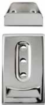
Art.-Nr.: KTS-1650 Kellnertaschenschloss 3-stufig zum Stecken, bestehend aus Ober- & Unterteil + 1 Rückenplatte Größe: 24 x 42mm, Farbe: silber Abnahme: Beutel mit 5 Stück