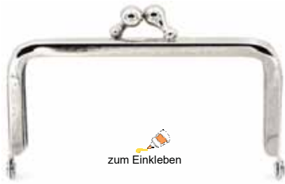
Art.-Nr.: BG1-8x4-V419-N zum Einkleben Größe: 8 x 4cm, Farbe: silber Abnahme: Beutel mit 5 Stück