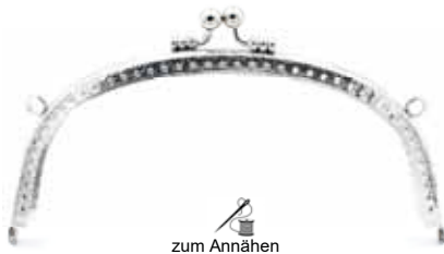
Art.-Nr.: BG-SW0167-N zum Annähen, mit 2 Ringen Größe: 16,5 x 7,4cm, Farbe: silber Abnahme: Beutel mit 5 Stück