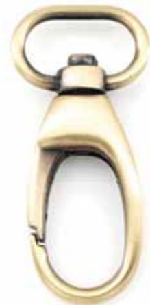
Art.-Nr.: KH-381-20-AB Karabinerhaken Größe: 57 x 31mm, f. Bandbreite: 20mm Farbe: altmessing Abnahme: Beutel mit 10 Stück