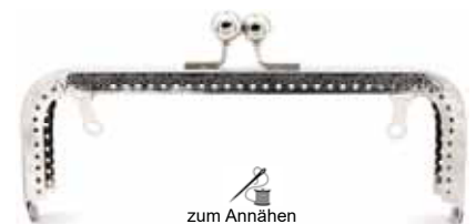
Art.-Nr.: BG-SW0186-N zum Annähen, mit 2 klappbaren Haken Größe: 18 x 6,5cm, Farbe: silber Abnahme: Beutel mit 5 Stück