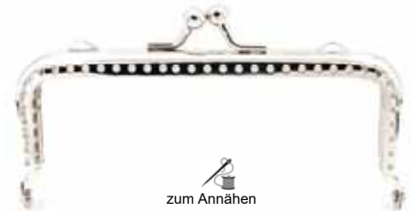
Art.-Nr.: BG-SW0104-N zum Annähen, mit 2 Ringösen Größe: 10,5 x 4,5cm, Farbe: silber Abnahme: Beutel mit 5 Stück

Abbildungen nicht in Originalgröße KW383 knauf textil 08/2018