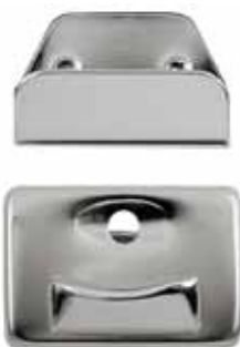
Art.-Nr.: KTS-1700 Börsenschloss zum Stecken, bestehend aus Ober- & Unterteil + 1 Rückenplatte Größe: 26 x 18mm, Farbe: silber Abnahme: Beutel mit 5 Stück