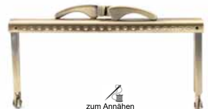
Art.-Nr.: BG-SW0126-AB zum Annähen Größe: 12,5 x 6,5cm, Farbe: altmessing Abnahme: Beutel mit 5 Stück