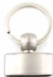
Art.-Nr.: SR-JP3215 Schlüsselanhänger zum Ansetzen an Bänder, etc. Größe: 32 x 14mm mit flachem Ring Ø innen: 27mm, inkl. 2 Schrauben Farbe: silber „gebürstet“ Abnahme: Beutel mit 10 Stück