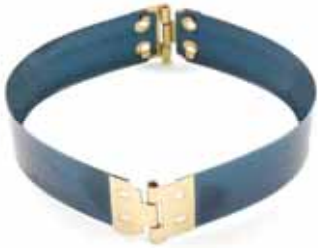
Art.-Nr.: KVS-9215 Klickverschluss f. Börsen, mit Gelenk bestehend aus 2 Blechen & 2 Stiften Größe: 92 x 15mm Abnahme: Beutel mit 10 Stück