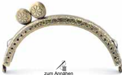
Art.-Nr.: BG-SW0105-AB zum Annähen, mit 2 Ringösen Größe: 10,5 x 5,5cm, Farbe: altmessing Abnahme: Beutel mit 5 Stück