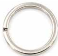
Art.-Nr.: SR-205 Schlüsselring Ø innen: 26mm, 3,5mm flach Farbe: silber Abnahme: Beutel mit 20 Stück