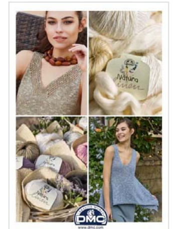
Poster 2017 Y9552